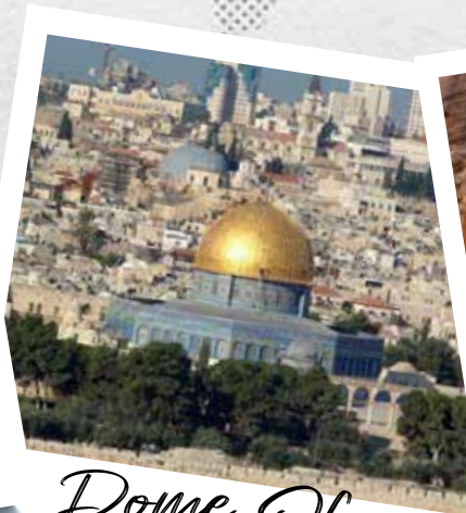
Dome Of The Rock